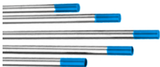
TUGSTENO AZUL WLa 20

Electrodos de Lantano. Son adecuados para aplicación de Soldadura DC y AC. Las principales áreas de aplicación son aleaciones de acero, aluminio, titanio, níquel, cobre y aleaciones de magnesio. Estos electrodos también son adecuados para su uso en soldadura con Micro-plasma.